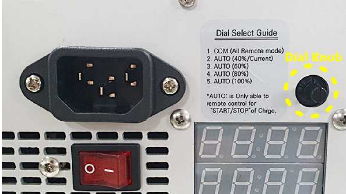
그림 1. 충전기 스위치 (그림 1은 700W 충전기, 1500W도 같은 원리)